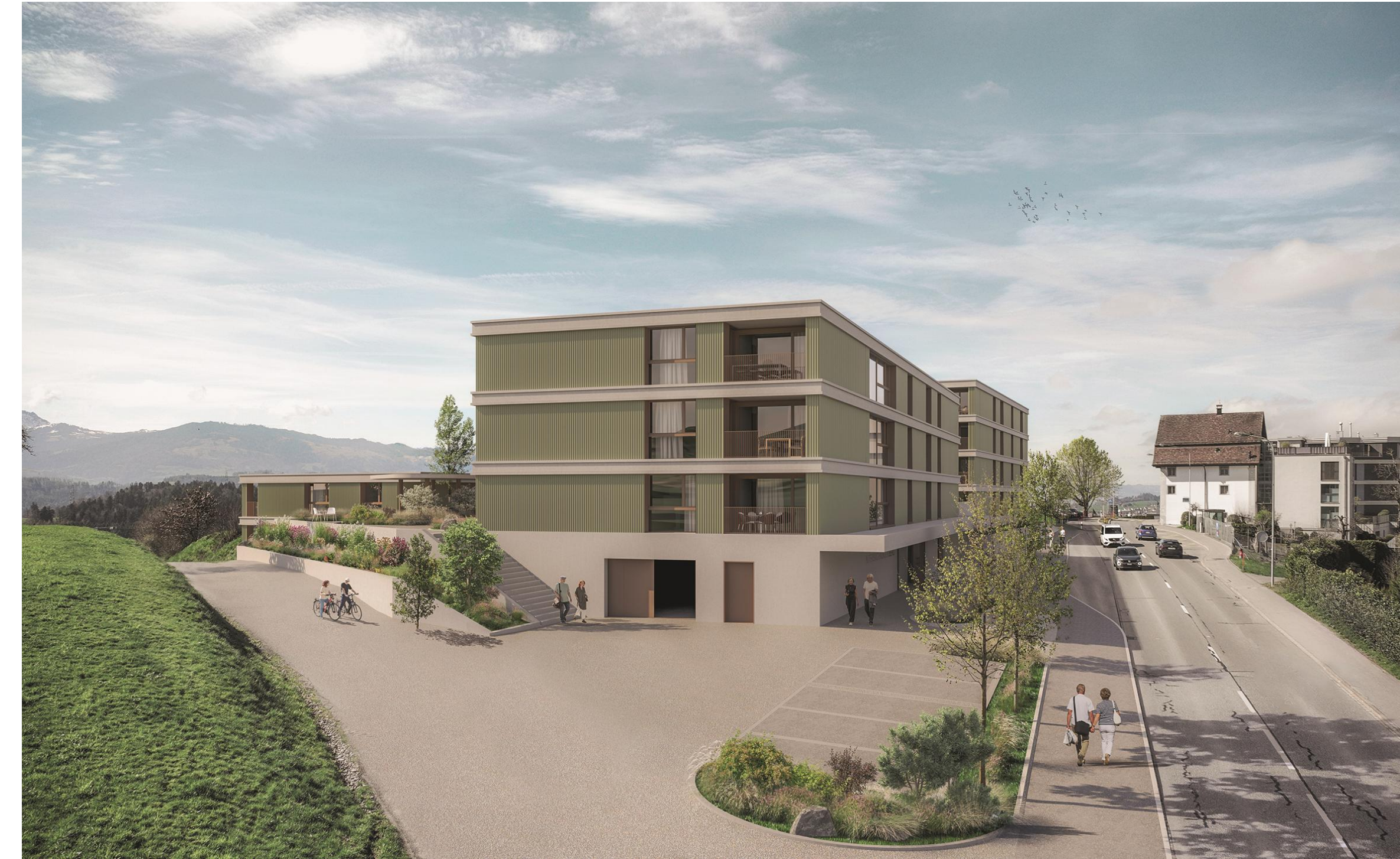
Visualisierung 02 Vorplatz Tiefgarage