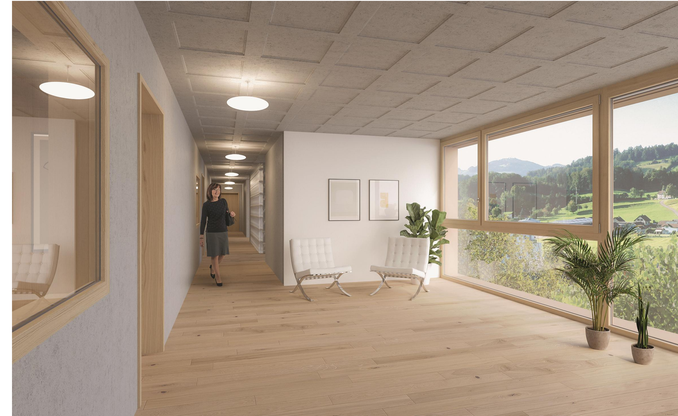
Visualisierung 05 Vorraum / Begegnung