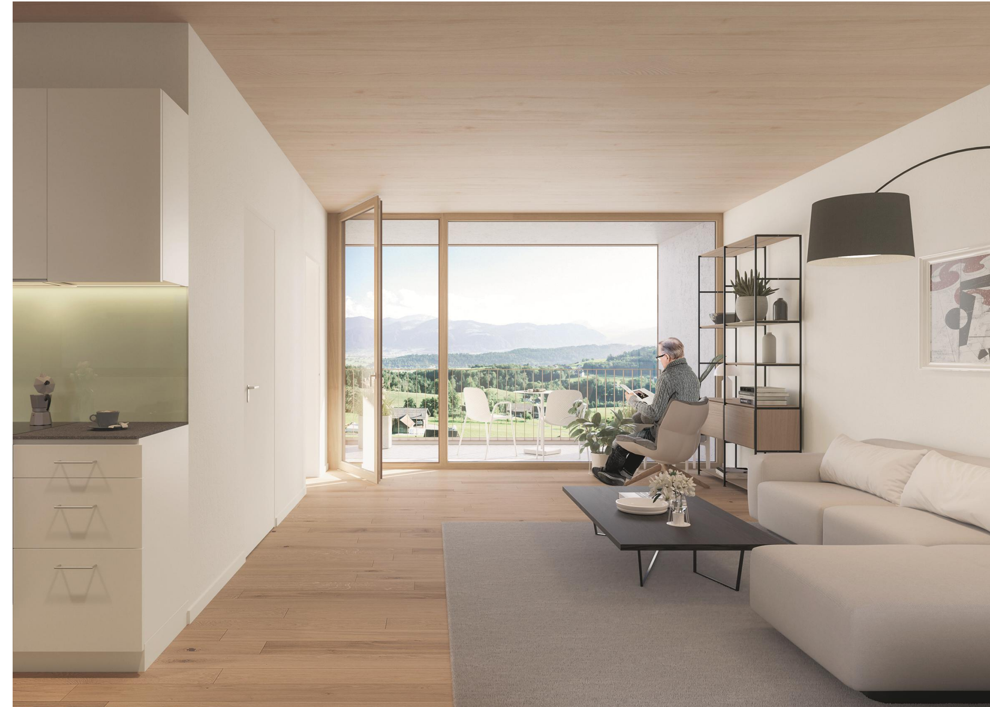
Visualisierung 04 Wohnung