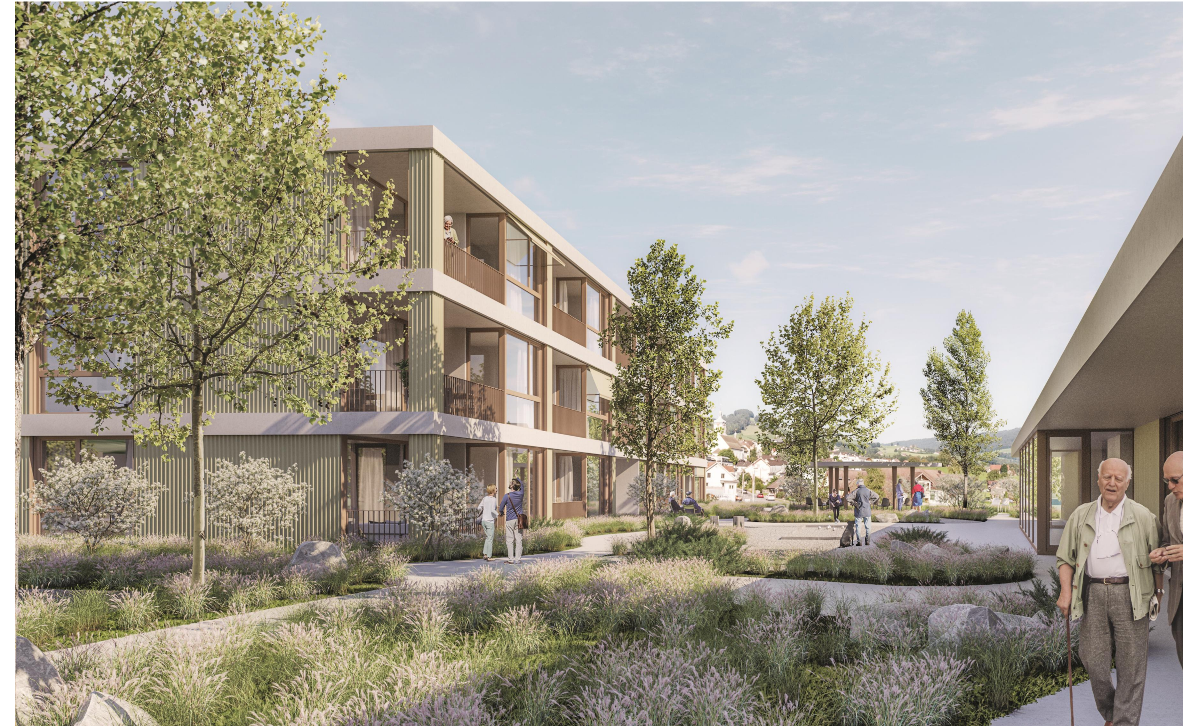
Visualisierung 03 Innenhof / Begegnung