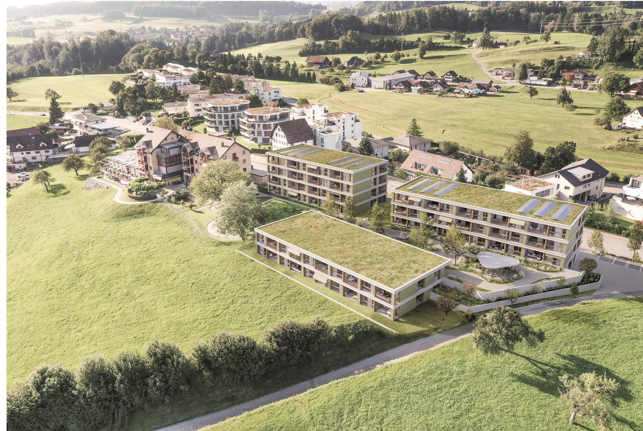
Visualisierung 01 Luftbild