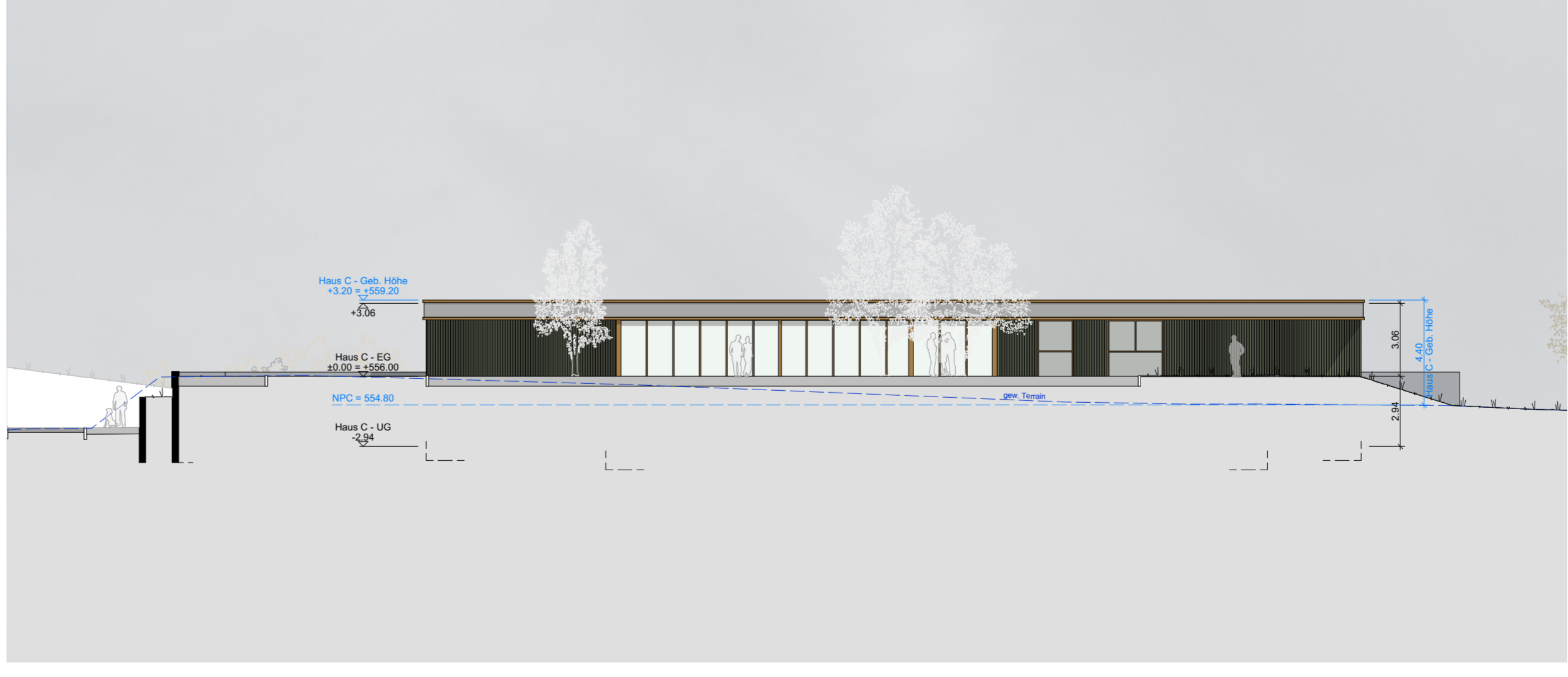
Gesamtansicht Haus C, Nord - 1:200

Die Bauherrschaft Genossenschaft Alterswohnungen Eschenbach Josef Blöchlinger & Franz Landolt Ort / Datum _____ Der Projektverfasser Architektur Rüegg & de pauw gerlings architektur Christian Rüegg & Jan de Pauw Gerlings (Architektur) Ort / Datum _____ Der Grundeigentümer Politische Gemeinde Eschenbach Vorname, Nachname Ort / Datum _____