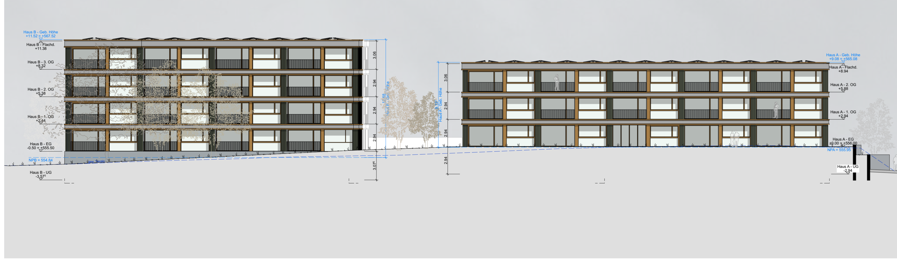
Gesamtansicht Haus A + B, Süd - 1:200