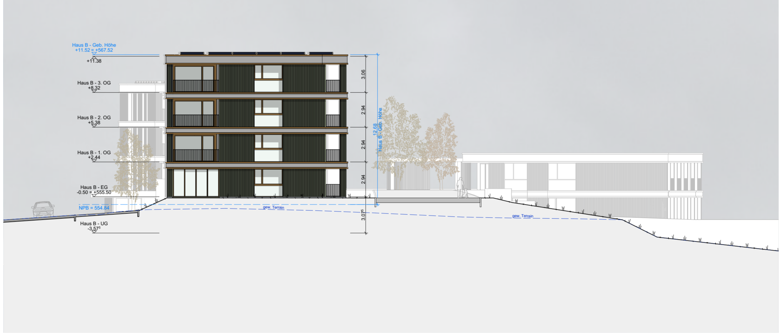
Gesamtansicht West - 1:200