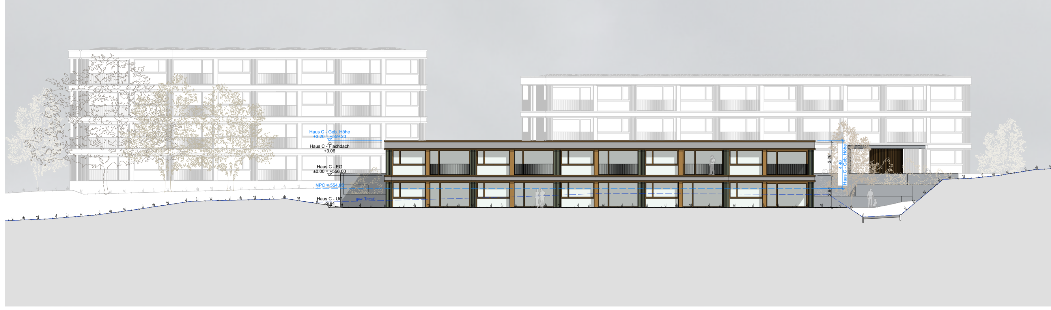
Gesamtansicht Süd - 1:200