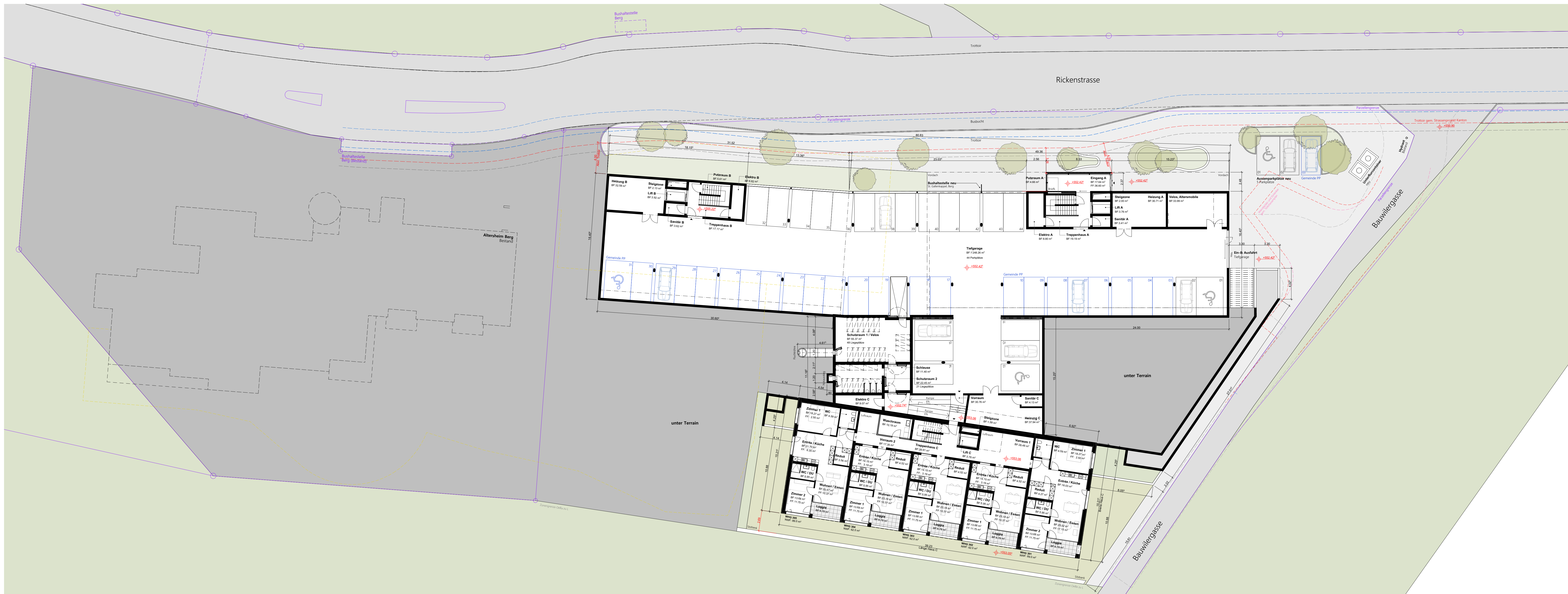
Grundriss Untergeschoss - 1:200