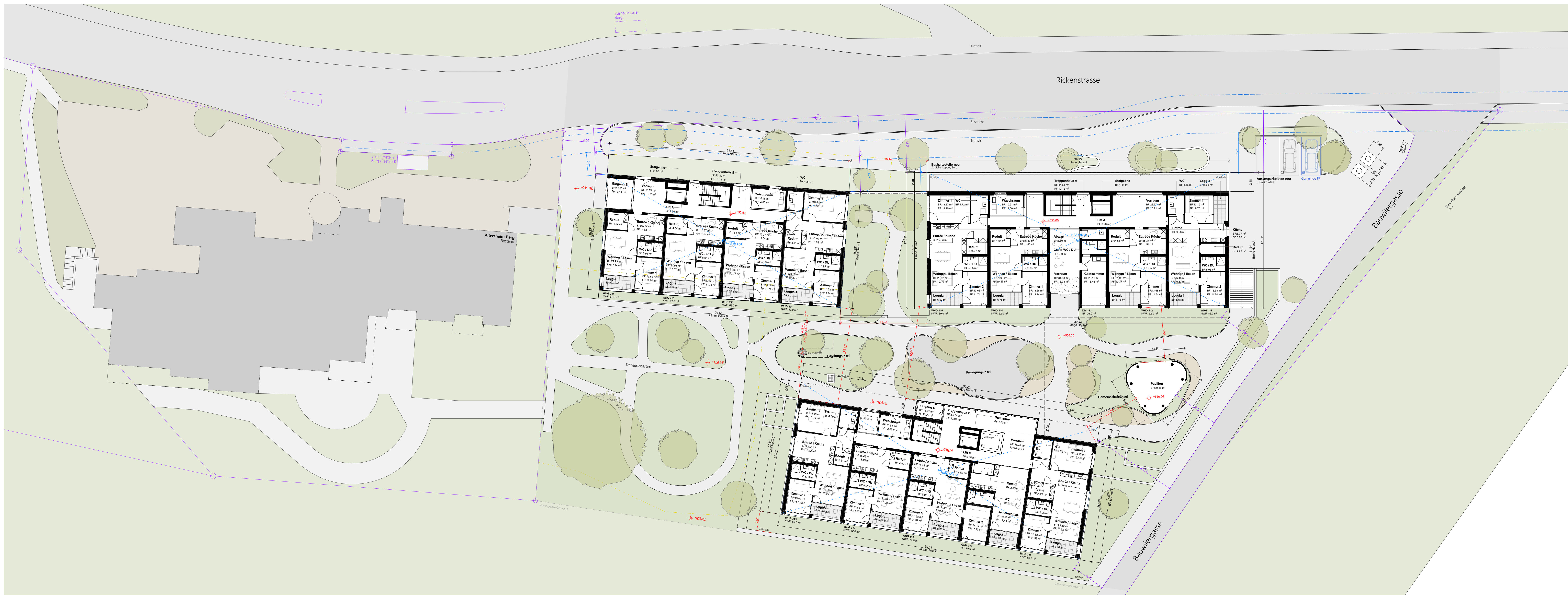
Grundriss Erdgeschoss - 1:200